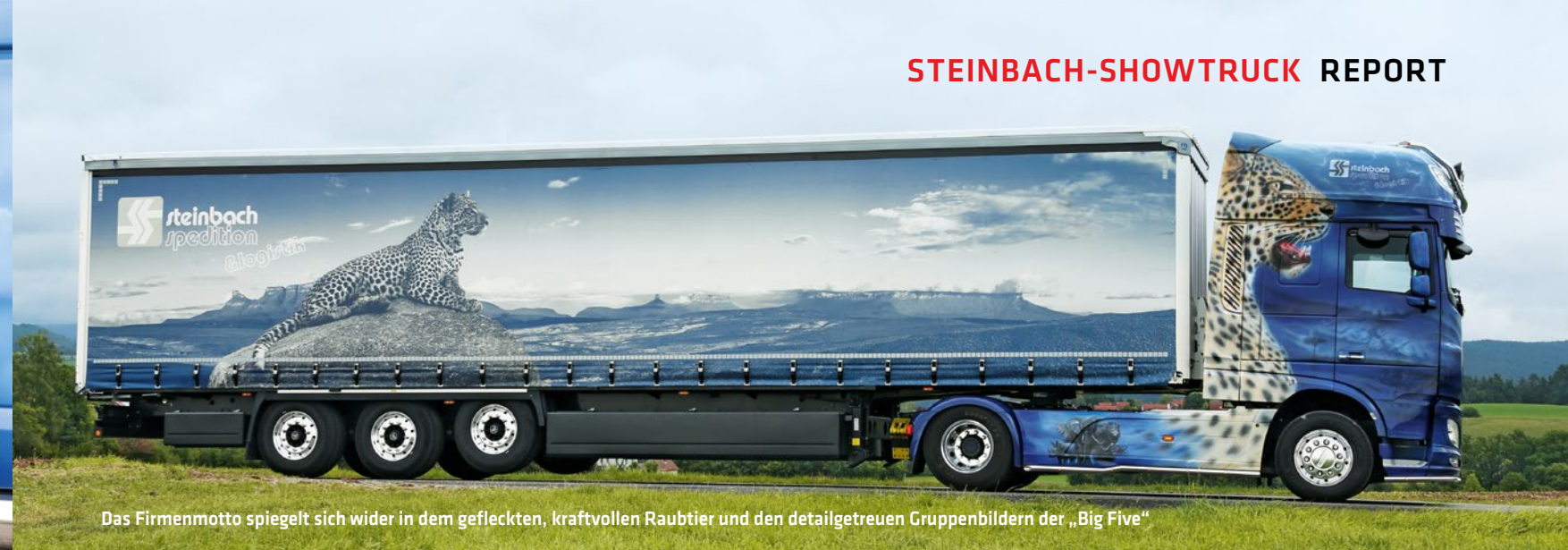
Das Firmenmotto spiegelt sich wider in dem gefleckten, kraftvollen Raubtier und den detailgetreuen Gruppenbildern der „Big Five“